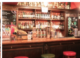
30種以上の樽生ビールと200種以上のウイスキーの品揃えは圧巻だ