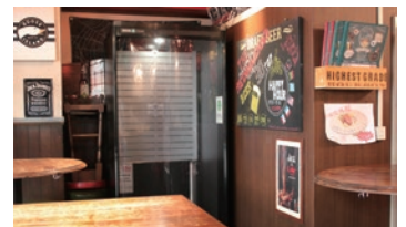
壁面のくぼみにスモーククリアスマートミニを設置。利用率は高いが、たばこの臭いや煙も漏れないので、スモーククリアスマートミニのすぐ脇にも客席を配置できる