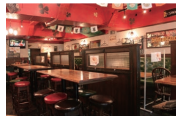
海外のパブにいるかのような気分でお酒と料理を楽しむ