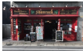
赤い外装の店舗は一際目立つ。店頭には、クリア分煙のPOPも張っている

『シャムロック六本木』は、世界のお酒とシェフが作るイタリア料理やイギリス料理を楽しめるガストロパブだ。平日は11時30分～翌5時（土日は15時～翌5時）の通し営業をしており、ランチ、昼呑み、パブ、レストラン、大きなスポーツイベントがある時はスポーツバーなど、様々な使い方ができる。六本木という場所柄もあってお客の喫煙率は高いが、禁煙者とは非喫煙者が共生できるクリア分煙の実施で、幅広い層のお客が集う。