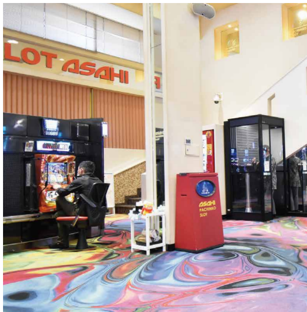
1人用は密にならず安心して喫煙できる。ウイルス除去99.995%の高性能フィルターを搭載している点も、遊技客の安心感をより高めている。

《パーラーアサヒ下到津店》では喫煙者に優しい喫煙環境を提供するため、エルゴジャパンの『スモーククリア』を導入。遊技台から近い場所に設置し、利便性を高めると同時に稼働ロスの軽減も図っている。