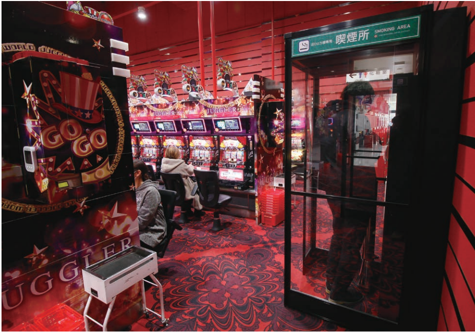
真冬のコロナ禍でも暖かい店内で喫煙できるように「スモーククリア」を設置した

日本の重要港湾として有名な函館港近くにある『マルハン函館港店』は、設置台数960台(パチンコ640台、パチスロ320台)の郊外店。今年、オープンから19年目を迎える同店は、地元常連客が集まるコミュニティの場になっている。