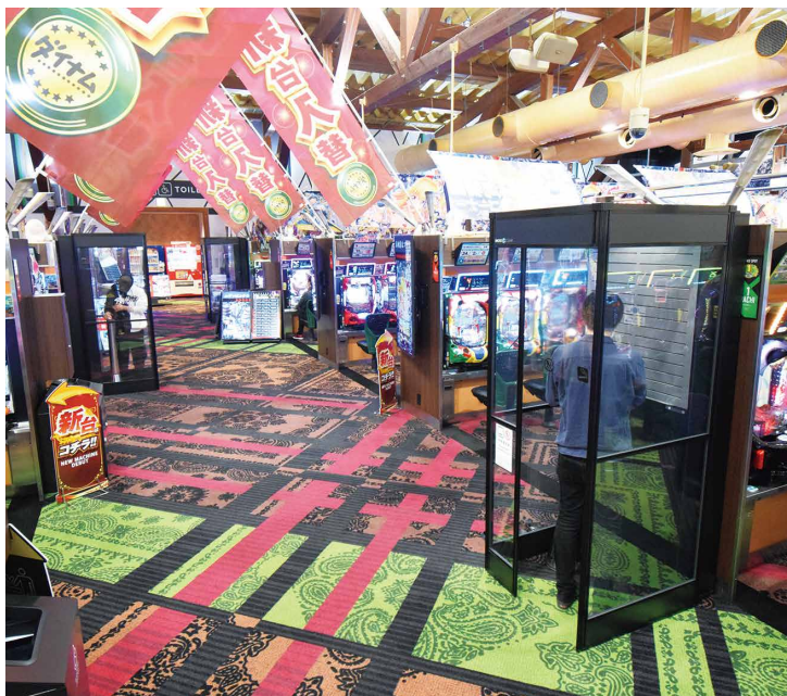
中央通路に「スモーククリア（1人用）」を3台設置。これにより、どこで遊技していても最短距離で喫煙ができ、お客様にとって利便性の高い喫煙環境を創出した。