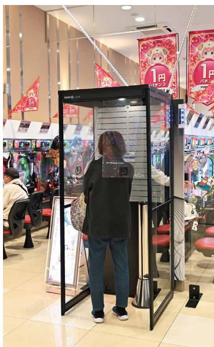
1人用のため、女性客でも周りを気にすることなく安心、安全、快適に喫煙可能。

青森県で地域に根差した営業を続ける《FORUM-1神田店》。既設の喫煙室撤去によるパチスロ増台リニューアルに合わせ『スマートミニ』を導入し、不足する喫煙環境問題を解決した。