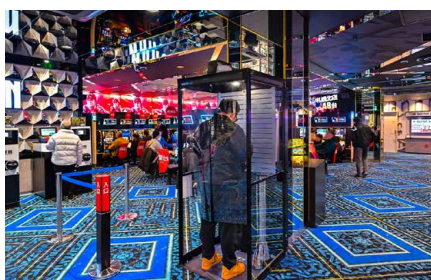
カウンター前のスペースにも設置。すぐ近くには新台コーナーがあり、喫煙の合間に自然と目に入るようにしている。

昨年8月にグランドオープンした《マルハン札幌北店》では、不足していた喫煙環境を補うべく、エルゴジャパンの喫煙ブース『スマートミニ』を導入。店内で快適に喫煙できる環境を整えた。