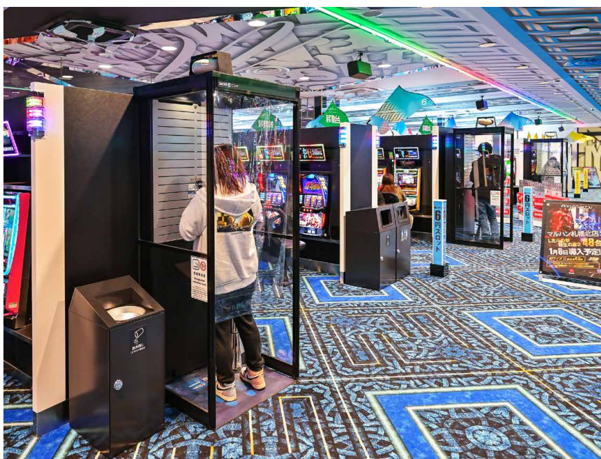
中央通路に設置した「スマートミニ」。どこで遊技していても最短距離で喫煙できるほか、1人用のため女性でも気兼ねなく利用することができる。