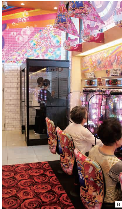
A・B / 「アプリイ中原」は近隣への影響を考慮し、屋内排気とした

「来年4月1日以降、パチンコホール内の喫煙環境がどうなるか、正確に把握している方が少ないのが実情です。喫煙ブースを導入したお店では『なぜ、設置したの』という質問が増えました。ホールの喫煙環境が変わること、そして当店では喫煙者の方に配慮して、喫煙できる空間を用意していますよ、ということをお知らせする、良い契