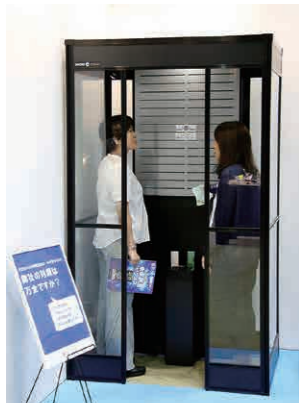
男性と同じ空間でタバコを吸うことを厭う女性もいる。展示会では「女性視点」で「スモーククリア」を体験する人も多かった